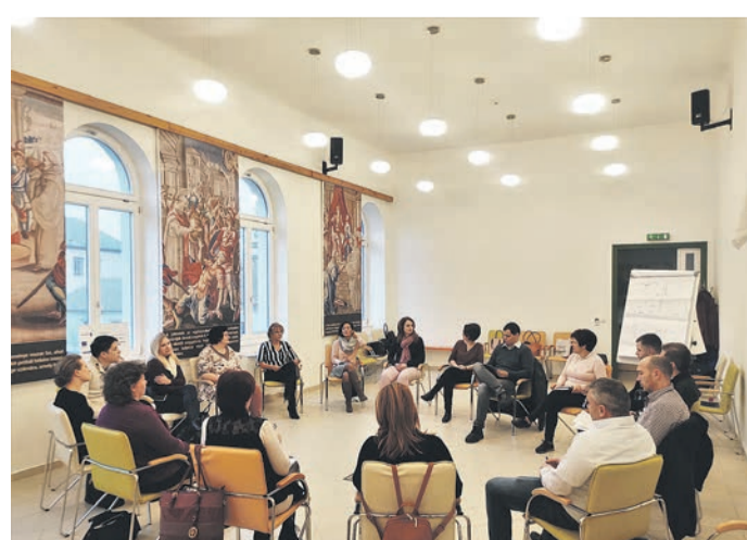
A felvétel az egyik szakmai tréningen készült, akkor, amikor még nem kellett viselni a szájmascokot

– Különböző kommunikációs csatornákat használva igyekeztünk megszólítani a magánszemélyeket és a munkáltatókat az online térben, nyomtatott sajtóban és személyesen. Azt tapasztaltuk, hogy azok a különböző HR témákban meghirdetett workshopok szólították meg leginkább a vállalkozásokat, egyéb szervezeteket, ahol