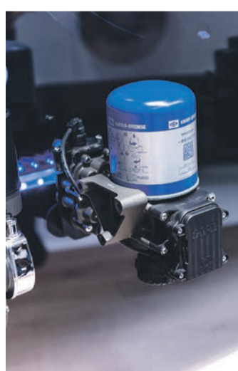
A cég új szabadalma