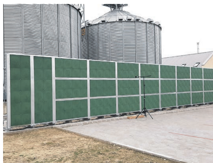
Ez a mobil zajcsökkentő fal hulladék alapanyagból készült

A vállalat hulladék-alapanyagból olyan zaj- és rezgéscsökkentő panelt fejlesztettek, amely padlólapként és zajcsökkentő panelként is alkalmazható. A kompozit termék ráadásul nagy teherbírású is. Tan Attila hangsúlyozta: a fejlesztési költségek nem voltak magasak, de ami a