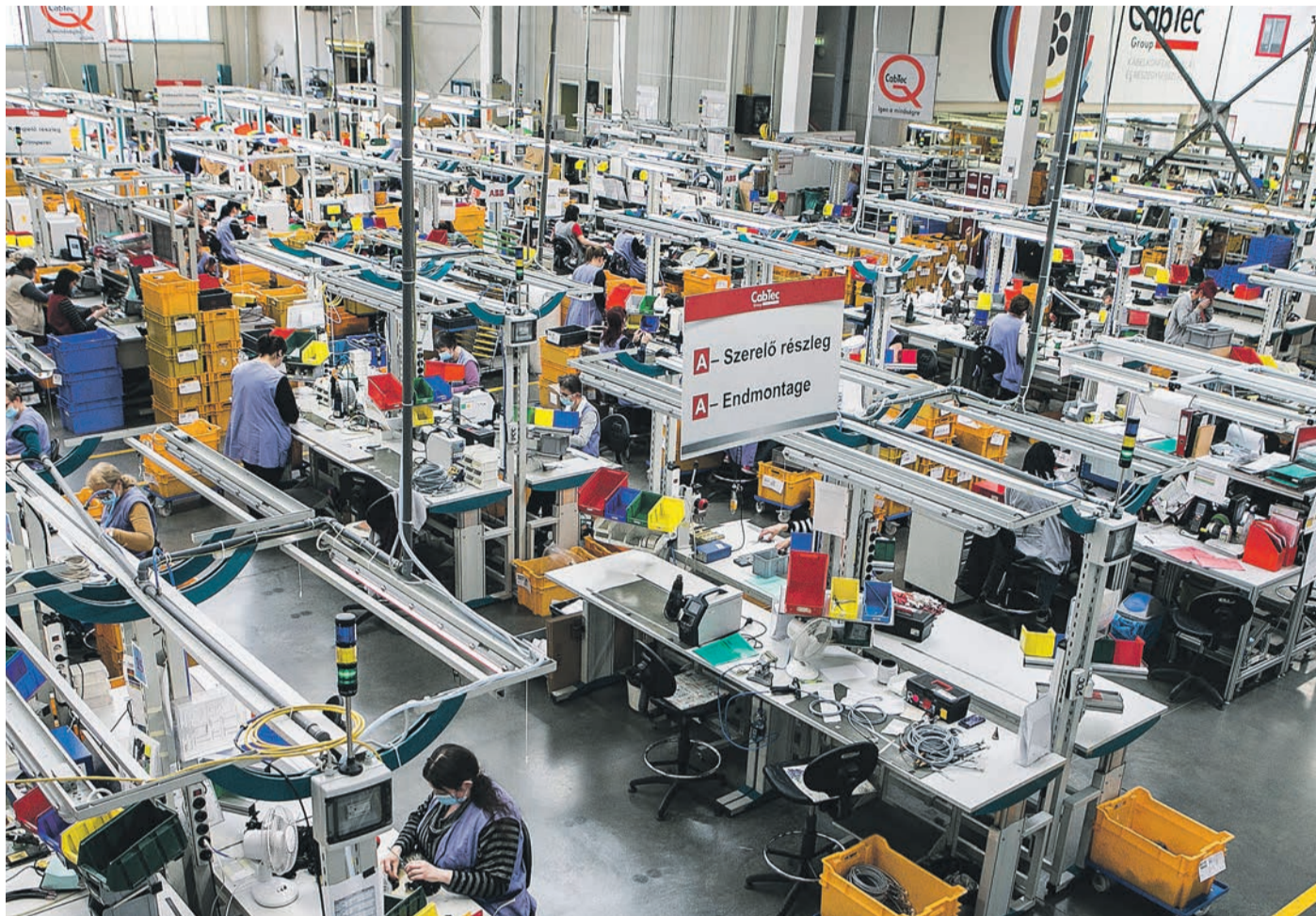
Néhány éven belül a kézi gyártás nagyobb részét az automatizálás váltja fel

GAZDASÁG Hogyan vonhatóak be az idősek a munkába?